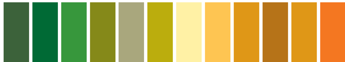
459 AA S3 ■ Oxide of Chromium Oxyde de Chrome Óxido de Cromo 311 A S1 □ Hooker's Green Vert de Hooker Verde de Hooker 503 A S1 □ Permanent Sap Green Vert de Vessie Permanent Verde Vejiga Permanente 447 A S1 □ Olive Green Vert Olive Verde Oliva 638 AA S1 □ Terre Verte (Yellow Shade) Terre Verte (Nuance Jaune) Tierra Verde (Matiz Amarillo) 294 A S2 □ Green Gold Or Vert Verde Oro 422 AA S1 ■ Naples Yellow Jaune de Naples Amarillo de Nápoles 425 AA S1 ■ Naples Yellow Deep Jaune de Naples Foncé Amarillo de Nápoles Oscuro 745 AA S1 ■ Yellow Ochre Light Ocre Jaune Clair Ocre Amarillo Claro 744 AA S1 ■ Yellow Ochre Ocre Jaune Ocre Amarillo 552 AA S1 □ Raw Sienna Terre de Sienna Naturelle Tierra de Siena Natural 285 AA S2 ■ Gold Ochre Ocre d'or Ocre Oro