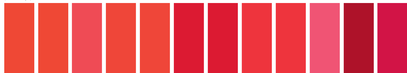
106 A S4 ■ I St Cadmium Scarlet Escarlate de Cadmium Escarlata de Cadmio 903 A S4 ■ I Cadmium-Free Scarlet Escarlate sans Cadmium Escarlata Libre de Cadmio 603 A S2 ■ St Scarlet Lake Laque Escarlate Laca Escarlata 094 A S4 ■ I St Cadmium Red Rouge de Cadmium Rojo Cadmio 901 A S4 ■ I St Cadmium-Free Red Rouge sans Cadmium Rojo Libre de Cadmio 097 A S4 ■ I St Cadmium Red Deep Rouge Foncé sans Cadmium Rojo Cadmio Oscuro 895 A S4 ■ I St Cadmium-Free Red Deep Rouge Foncé sans Cadmium Rojo Oscuro Libre de Cadmio 726 A S1 ■ St Winsor Red Rouge Winsor Rojo Winsor 576 A S4 □ II St Rose Doré Rosa Dorado 548 A S3 □ II Quinacridone Red Rouge Quinacridone Rojo Quinacridona 725 A S1 ■ St Winsor Red Deep Rouge Winsor Foncé Rojo Winsor Oscuro 466 A S3 □ St Permanent Alizarin Crimson Alizarine Cramoisie Permanent Carmesi Alizarina Permanente