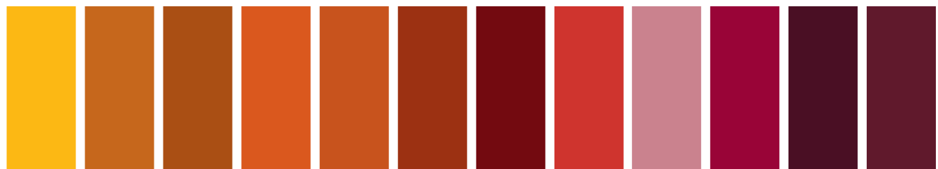
547 A S3 □ Quinacridone Gold Oro Quinacridona 059 AA S1 ■ Brown Ochre Ocre Brun Ocre Marrón 381 AA S1 ■ Magnesium Brown Brun Magnésium Marrón Magnésio 074 AA S1 □ Burnt Sienna Terre de Sienna Brûlée Tierra de Siena Tostada 362 AA S1 ■ Light Red Rouge Clair Rojo Claro 678 AA S1 ■ Venetian Red Rouge de Venise Rojo de Venecia 317 AA S1 ■ Indian Red Rouge Indien Rojo Indio 056 A S1 ■ Brown Madder Brun de Garance Pardo de Granza 537 AA S2 ■ Rose of Poterie Rosa de Potter 507 A S3 ■ Perylene Maroon Marrón Pérylène Marrón Perileno 470 A S2 □ Perylene Violet Violet de Pérylène Violeta de Perileno 125 AA S2 ■ Caput Mortuum Violet Caput Mortuum Violeta Caput Mortuum