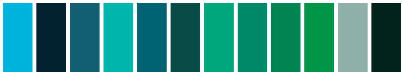
379 A S2 ■ Manganese Blue Hue Nuance de Bleu de Manganèse Tono de Azul Manganoso 526 A S2 □ Phthalo Turquoise Turquoise de Phthalo Turqueso Ftalo 697 A S3 □ Aqua Green Vert d'eau Verde Agua 191 AA S4 ■ Cobalt Turquoise Light Turquoise de Cobalt Clair Turquesa de Cobalto Claro 190 AA S4 ■ Cobalt Turquoise Turquoise de Cobalt Turquesa de Cobalto 185 AA S3 ■ Cobalt Green Deep Vert de Cobalt Foncé Verde de Cobalto Oscuro 184 AA S4 ■ Cobalt Green Vert de Cobalt Verde de Cobalto 719 A S1 □ Winsor Green (Blue Shade) Vert Winsor (Nuance Bleue) Verde Winsor (Matiz Azul) 692 AA S3 □ Viridian Vert de Guignet Viridiano 721 A S1 □ Winsor Green (Yellow Shade) Vert Winsor (Nuance Jaune) Verde Winsor (Matiz Amarillo) 637 AA S1 ■ Terre Verte Terre Verte Tierra Verde 460 A S2 □ Perylene Green Vert de Pérylène Verde de Perileno