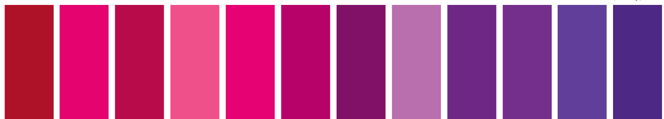
004 B S1 □ St Alizarin Crimson Alizarine Cramoisie Carmesi Alizarina 479 A S3 □ St Permanent Carmine Carmin Permanent 502 A S3 □ II St Permanent Rose Rose Permanent Rosa Permanente 587 B S4 □ Rose Madder Genuine Alizarine Veritable Granza Rosa Genuina 448 B S2 ■ Opera Rose Fleur de Rose Opéra Flor de Rosa Ópera 545 A S3 □ Quinacridone Magenta Magenta Quinacridone Magenta Quinacridona 489 A S3 □ I St Permanent Magenta Magenta Magenta Permanente 192 AA S4 ■ I Cobalt Violet Violet de Cobalto Violeta de Cobalto 491 A S3 ■ St Permanent Mauve Mauve Permanent 550 A S3 □ I Quinacridone Violet Violet Quinacridone Violeta Quinacridona 672 A S2 ■ I Ultramarine Violet Violet Outremer Violeta Ultramar 733 A S1 □ St Winsor Violet (Dioxazine) Violet Winsor (Dioxazine) Violeta Winsor (Dioxacina)