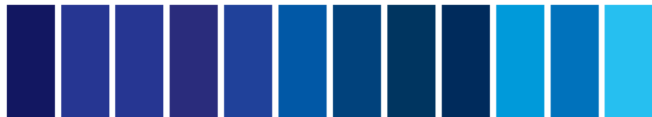
321 A S3 ■ Indanthrene Blue Bleu d'indanthrène Azul de Indantreno 180 AA S4 ■ Cobalt Blue Deep Bleu de Cobalt Foncé Azul de Cobalto Oscuro 263 A S2 □ I French Ultramarine Outremer Français Ultramar Francés 710 A S3 □ I Smalt (Dumont's Blue) Smalt (Bleu Dumont) Azul Esmalte (Dumont) 667 A S2 □ I Ultramarine (Green Shade) Outremer (Nuance Verte) Ultramar (Matiz Verde) 178 AA S4 ■ Cobalt Blue Bleu de Cobalt Azul de Cobalto 709 A S1 ■ Winsor Blue (Green Shade) Bleu Winsor (Nuance Verte) Azul Winsor (Matiz Verde) 010 B S1 □ Antwerp Blue Bleu d'Anvers Azul de Amberes 538 A S1 □ Prussian Blue Bleu de Prusse Azul de Prusia 707 A S1 ■ Winsor Blue (Green Shade) Bleu Winsor (Nuance Verte) Azul Winsor (Matiz Verde) 140 AA S3 ■ Cerulean Blue (Red Shade) Bleu de Céruléum (Nuance Rouge) Azul Cerúleo (Matiz Rojo) 137 AA S3 ■ Cerulean Blue Bleu de Céruléum Azul Cerúleo