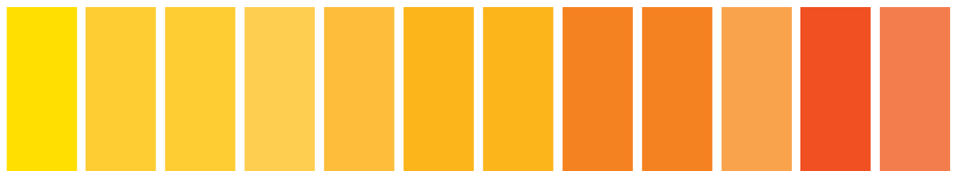
267 A S1 ■ St New Gamboge Gomme Gutte Gustagamba Nuevo 108 A S4 ■ I Cadmium Yellow Jaune de Cadmium Amarillo de Cadmio 890 A S4 ■ I Cadmium-Free Yellow Jaune sans Cadmium Amarillo Libre de Cadmio 731 A S1 ■ St Winsor Yellow Deep Jaune Winsor Foncé Amarillo Winsor Oscuro 319 A S1 □ II Indian Yellow Jaune Indien Amarillo Indio 111 A S4 ■ I Cadmium Yellow Deep Jaune de Cadmium Foncé Amarillo de Cadmio Oscuro 891 A S4 ■ I Cadmium-Free Yellow Deep Jaune Foncé sans Cadmium Amarillo Oscuro Libre de Cadmio 089 A S4 ■ I Cadmium Orange Orange de Cadmium Naranja de Cadmio 899 A S4 ■ I Cadmium-Free Orange Orange sans Cadmium Naranja Libre de Cadmio 724 A S1 ■ St Winsor Orange Orange Winsor Naranja Winsor 650 A S3 □ I Transparent Orange Orange Transparente Naranja Transparente 723 A S1 ■ St Winsor Orange (Red Shade) Orange Winsor (Nuance Rouge) Naranja Winsor (Matiz Rojo)