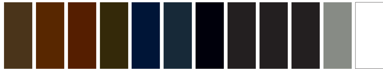
554 AA S1 □ Raw Umber Terre d'ombre Naturelle Tierra de Sombra Natural 076 AA S1 □ Burnt Umber Terre d'ombre Brûlée Tierra de Sombra Tostada 676 AA S1 ■ Permanent Brun Van Dyck Pardo Van Dyck 609 AA S1 ■ Sepia Sépia 322 A S1 ■ Indigo Indigo 465 A S1 ■ Payne's Gray Gris de Payne 430 A S1 ■ Neutral Tint Tinte Neutre 331 AA S1 ■ Ivory Black Noir d'ivoire Negro de Marfil 337 AA S1 ■ Lamp Black Noir de Fumée Negro de Humo 386 AA S1 ■ Mars Black Noir de Mars Negro de Marte 217 AA S1 ■ Davy's Gray Gris de Davy 150 AA S1 ■ Chinese White Blanc de Chine Blanco de China